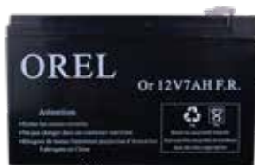
B7AH 12V 7.0 A/H Battery