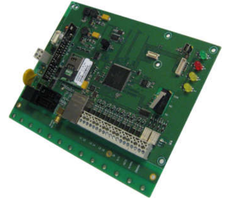
TSEC 3000 E versie 10-28VDC