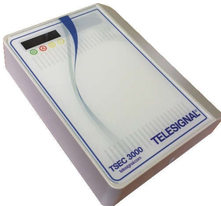
TSEC 3000 E kunststof behuizing 10-28VDC