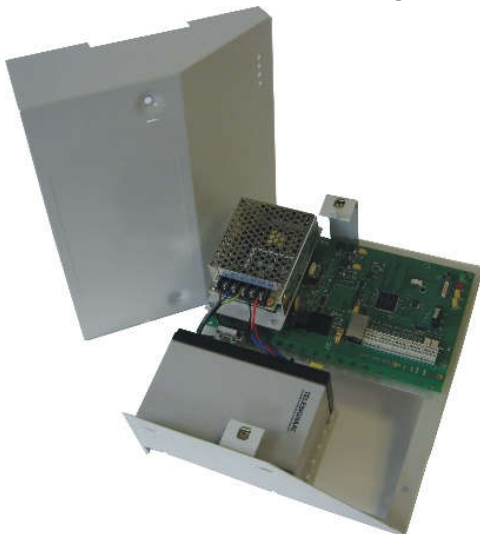
TSEC 3000 C versie 90-260VAC