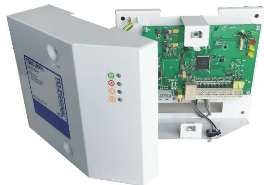
TSEC 3000 E metalen behuizing 10-28VDC