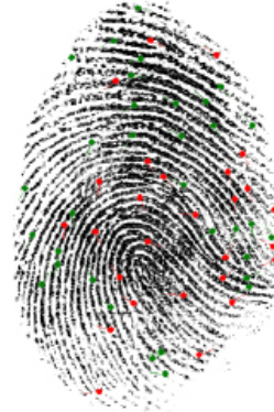
Fig.1: Afbeelding van wat een ievo-lezer scant en de belangrijkste minutiae-kenmerken.

ievo-lezers bevatten geen vergrendelingsmechanismen of deurrelais, wat betekent dat als een lezer zou worden verwijderd, uw toegangspunt veilig zou blijven en uw gegevens veilig zouden blijven. De lezers zou voor de aanvalleur nutteloos zijn, omdat deze geen gegevens bevat.